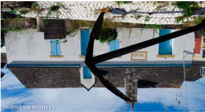
La Maison des Douanes