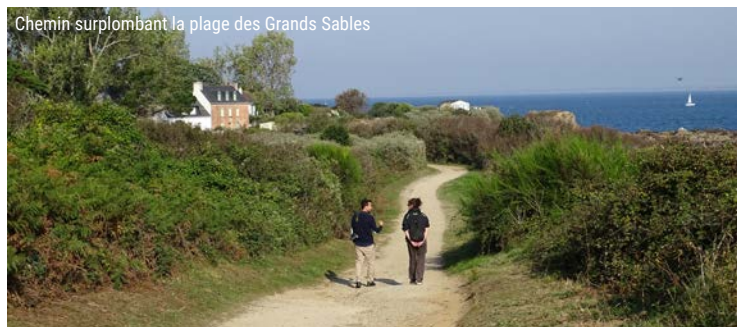
Chemin surplombant la plage des Grands Sables

6 Traversez la route, allez en face, puis à gauche dans le sentier et remontez le chemin jusqu'à la route menant à Locmaria. Traversez le village de Kerliet et prenez le premier chemin de terre à droite qui vous mène au bourg. Continuez tout droit sur la route et prenez la troisième à gauche pour rejoindre votre point de départ.