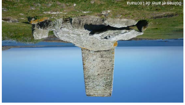
Dolmen et amer de Locmaria